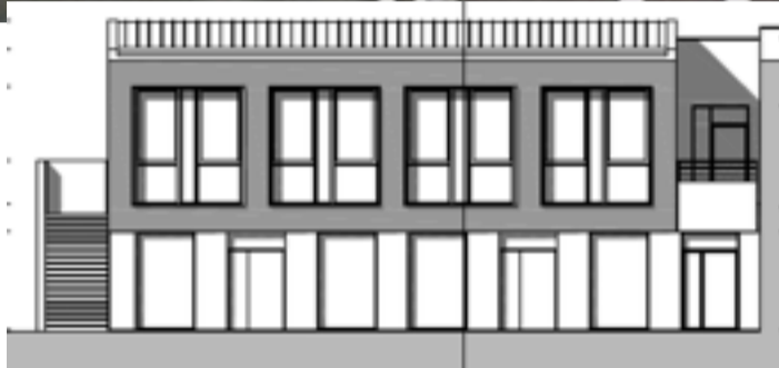
Le nouveau bâtiment vu de la cour